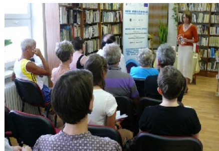
Krst spoločného zborníka literárnych klubov z Dolného Kubína a Limanovej.

Členovia literárnych klubov, pôsobiacich pri knižniciach v Dolnom Kubíne a Limanovej mali možnosť publikovať svoju novú literárnu tvorbu v zborníku Masová evakuácia púpav. Pracovníci verejných knižníc Žilinského kraja sa zúčastnili na poznávacej exkurzii v knižnici a múzeu v Bielsko-Bialej.