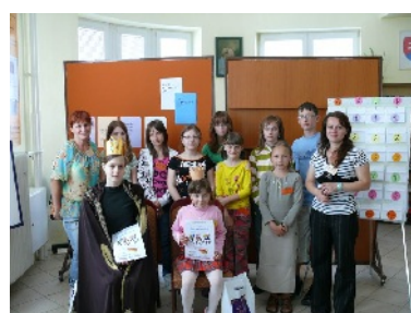
Kráľ čitateľov – súťaž o najaktívnejšieho detského čitateľa.