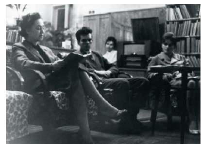
Literárny večer v rámci Hviezdoslavovho Kubína.

Spôsob a úroveň realizácie strediskového systému vzbudil pozornosť nielen na Slovensku, ale aj v zahraničí. Do Dolného Kubína prichádzali študijné exkurzie z rôznych knižníc, napr. Bratislavy, Liptovského Mikuláša, Považskej Bystrice, Prievidze, Kremnice, Rožňavy, Trenčína, Trnavy, Nových Zámkov ai. Dosiahnuté výsledky strediskového systému