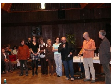
Celoslovenské stretnutie členov literárnych klubov na Hviezdoslavovom Kubíne.