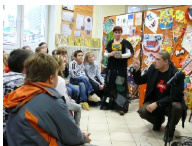
Knižný vševedko – regionálna literárno-vedomostná súťaž pre žiakov 5. ročníkov základných škôl.