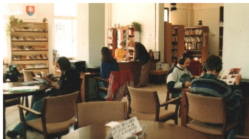
Priestory čítárne a hudobného oddelenia.

počítačovej sieti a zakúpeniu knižnično-informačného systému Libris, v ktorom sa postupne začalo retro spracovanie fondu a akvizícia a katalogizácia nových prírastkov. V roku 1995 sa začal používať modul Biblis pre účely regionálnej bibliografie na analytické spracovanie regionálnej článkovej produkcie. V roku 1997 prešli všetky oddelenia na automatizovaný výpožičný systém, čím sa stali všetky základné knižničné procesy plne automatizované.