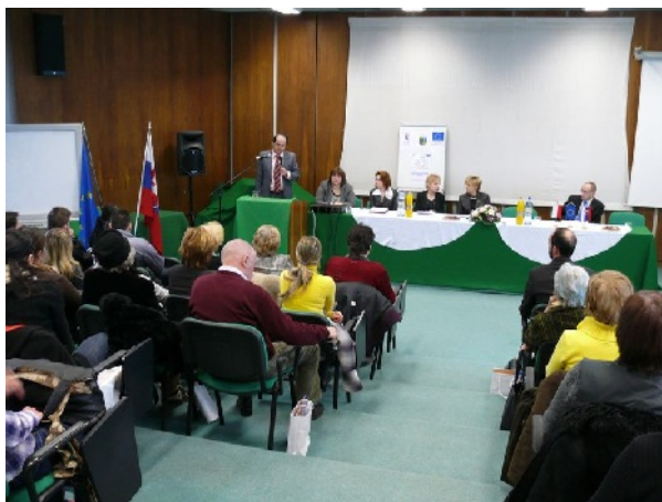
Konferencja na temat slowacko-polskiej współpracy transgranicznej w kulturze – 2011 r.

knihy, besedy s autorkami a výtvarné dielne inšpirované vydanou knihou v knižniciach v Dolnom Kubíne, Limanowej a v Mestskej knižnici Ružomberok. V rámci projektu sa pracovníci Oravskej knižnice a ďalších verejných knižníc Žilinského kraja zúčastnili na poznávacej exkurzii v mestách a knižniciach Limanowa a Zakopane, uskutočnili sa stretnutia členov a priaznivcov Poľského klubu, obohatil sa fond knižnice o nové publikácie a filmy na DVD nosičoch v poľskom jazyku, ako aj preklady klasickej a súčasnej poľskej literatúry,