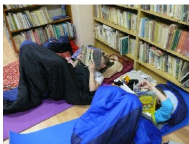
Noc s Andersenom.

Rok regionálnej osobnosti – pripomenutie si osobnosti, ktorá sa svojim životom a prácou zaslúžila o kultúrno-spoločenský rozvoj svojho regiónu viacerými podujatiami, organizovanými pre širokú verejnosť.