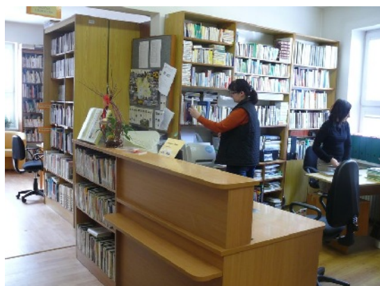
Oddelenie náučnej literatúry.

Oddelenie beletrie ponúka čitateľom fond krásnej literatúry – klasickú a súčasnú pôvodnú i prekladovú prózu, romány, poviedky, mimočítankovú literatúru pre študentov, divadelné hry, sci-fi, detektívky, dobrodružnú, oddychovú a humoristickú literatúru. V súčasnosti je z dôvodu plánovanej rekonštrukcie a prístavby budovy knižnice zlúčené s čítárňou a umenovedným oddelením, kde čitatelia nájdu slovenskú, českú a prekladovú