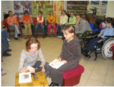
Projekt zameraný na integrácia znevýhodnených používateľov do prirodzeného prostredia knižnice.

Knižnica dlhodobo spolupracuje aj so Spojenou školou – Špeciálnou ZŠ pre žiakov s telesným postihnutím. Integrácia znevýhodnených používateľov do prirodzeného prostredia knižnice, prekonávanie komunikačných a spoločenských bariér, motivovanie k čítaniu a rozvíjanie ich čitateľských zručností patrí k prioritám kultúrno-výchovnej činnosti knižnice.