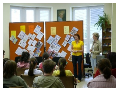
Najlepší školský časopis.