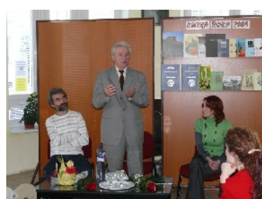
Kniha Oravy – čitateľská anketa o najzaujímavejšiu vydanú knižnú publikáciu s regionálnou tematikou.