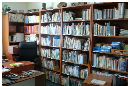
Úsek bibliografie a regionálnej literatúry.

Úsek bibliografie a regionálnej literatúry sústreďuje a sprístupňuje fond regionálnych dokumentov, ktorých obsah sa dotýka regiónu Orava. Fond tvoria – monografie, turistickí sprievodcovia, vlastivedné publikácie miest a obcí regiónu Orava, biografické slovníky, bibliografie, zborníky, diplomové, bakalárske a seminárne práce na regionálne témy, mapy, pohľadnice, plagáty, pozvánky a iné drobné tlače, audiovizuálne dokumenty, regionálne, mestské, obecné a školské periodiká. Realizuje monitoring tlače, spracováva a sprístupňuje článkovú databázu a databázu regionálnych osobností, poskytuje informácie z regionálnych kartoték a archívu výstrižkov, spracováva a vydáva bibliografické materiály, poskytuje rešeršné služby na regionálne témy.