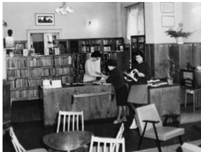
Oddelenie pre dospelých v budove Domu osvetu.