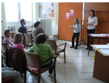
Čítajme si... – celoslovenský maratón čítania detí.