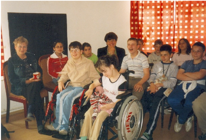
Projekt zameraný na integrácia znevýhodnených používateľov do prirodzeného prostredia knižnice.

Aby táto snaha bola úspešná dopĺňame knižný fond interaktívnymi knihami so zvukovými a svetelnými signálmi, reliéfnymi obrázkami a stavebnicovými dielmi, pri ktorých zdravotne znevýhodnené deti môžu využívať viac zmyslov, čím je znásobená názornosť vysvetľovaných javov. Špeciálne publikácie a nábytok vhodný pre používateľov so špecifickými potrebami získava knižnica prostredníctvom projektov.