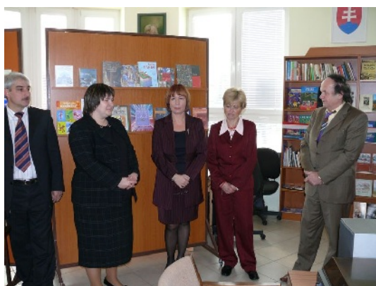
Otvorenie Poľskej knižnice.

Školské kluby detí ZŠ v Dolnom Kubíne navštevujú knižnicu pravidelne v stredu a piatok popoludní. Deti sa venujú hlasnému a tichému čítaniu, pracujú v tvorivých dielňach, súťažia.