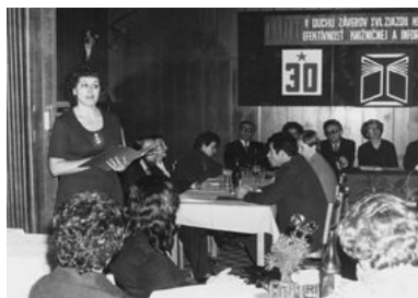
Slávnostné stretnutie pri príležitosti 30. výročia založenia knižnice.

Činnosť knižnice v osemdesiatych rokoch významnou mierou ovplyvnilo získanie vlastnej budovy v roku 1981, kde sa sústredili všetky organizačné zložky knižnice – riaditeľstvo, ekonomický úsek, metodika, úsek doplňovania a spracovania fondov, oddelenie beletrie s čítárňou, oddelenie politickej a náučnej literatúry, oddelenie pre deti a mládež a úsek regionálnej bibliografie. V roku 1985 začalo svoju činnosť hudobné oddelenie, do fondu knižnice sa začali kupovať aj gramofónové platne a magnetofónové pásky. Materiálno-technické a finančné podmienky pre činnosť knižnice boli stabilizované, knižnica rozvíjala svoje aktivity vo všetkých oblastiach knižničnej práce a dosahovala kvantitatívny nárast v sledovaných ukazovateľoch i kvalitatívne zlepšovanie rozsahu poskytovaných služieb. Podstatným faktorom skvalitňovania knihovníckej práce bola účasť pracovníkov na odborných kurzoch pre všetky knižničné špecializácie, ktoré sa realizovali v doškološovacom stredisku Matice slovenskej, ako aj zvyšovanie kvalifikácie pracovníkov formou diaľkového štúdia na Strednej knihovníckej škole a Filozofickej fakulte UK v Bratislave.