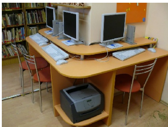
Prístup na bezplatný internet.

Používateľom knižnice sa môže stať fyzická alebo právnická osoba na základe vyplnenej prihlášky, po predložení identifikačného preukazu a uhradení ročného členského poplatku podľa aktuálneho cenníka; deti a mládež do 15 rokov sa môžu stať používateľmi len so súhlasom zákonného zástupcu. Svojím používateľom poskytuje knižnica komplexné knižnično-informačné služby, absenčne – mimo knižnice si môže vypožičať knihy a staršie čísla periodík, prezenčne – v čítarni a študovniach sú k dispozícii audiovizuálne dokumenty, najnovšie čísla periodík, osobitné regionálne dokumenty a knihy z príručných knižníc jednotlivých oddelení. Čitateľ si môže naraz požičať najviac 15 dokumentov, detskí čitatelia 10; výpožičná lehota kníh je 30 dní, periodík 7 dní, dokumentov špeciálneho fondu 14 dní.