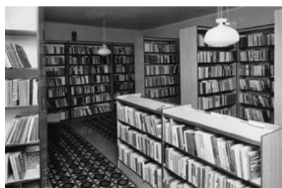
Priestory náučného oddelenia krátko po otvorení novej budovy v r. 1981.

Úsek regionálnej bibliografie rozvíjal svoju činnosť v intenciách Úpravy Ministerstva kultúry SSR o koordinácii bibliografickej činnosti, účinnej od roku 1981. Úsek sa zameriaval na získavanie, spracovávanie, uchovávanie a sprístupňovanie regionálnej periodickej a neperiodickej produkcie, excerpovanie a spracovávanie článkov z regionálnych i celoštátnych periodík, vydávanie bibliografickej ročenky Orava v tlači, personálnych a odporúčajúcich bibliografií, poskytovanie bibliografických a faktografických informácií regionálneho charakteru používateľom, priebežnú tvorbu kartoték – autorskú, topografickú, systematickú a osobností.