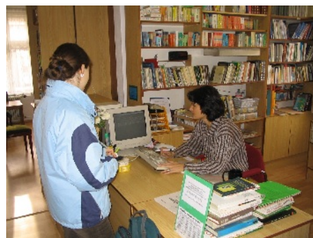
Oddelenie náučnej literatúry.

Aplikácia výpočtovej techniky prispela aj k výraznému zvýšeniu kvality, úrovne a rýchlosti realizácie jednotlivých bibliografických činností na úseku regionálnej bibliografie. Z regionálnej bázy dát bola od roku 1977 vydávaná výberová regionálna bibliografia Orava v tlači. Intenzita využívania služieb regionálnej bibliografie sa priebežne zvyšovala. Najsilnejšia používateľská skupina sa sformovala z radov žiakov základných škôl a študentov stredných škôl, kde sa učitelia vo zvýšenej miere orientovali vo vyučovacom