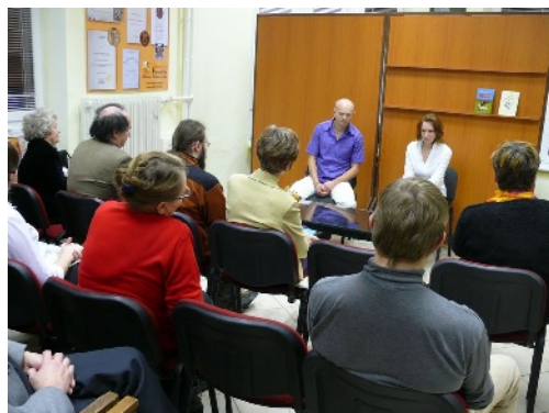
Krst zborníka literárneho klubu Fontána.

Fontána – literárny klub, ktorý pri knižnici pôsobí od roku 1999 a je otvorený každému, kto sa zaujíma o literatúru a umenie. Súčasťou každomesačných stretnutí sú tvorivé dielne, čítanie a rozbory vlastnej tvorby, diskusie o literatúre, informácie o knižných novinkách a literárnych súťažiach. Členovia sa zúčastňujú literárnych súťaží a prehliadok umeleckého slova, svoju tvorbu predstavujú