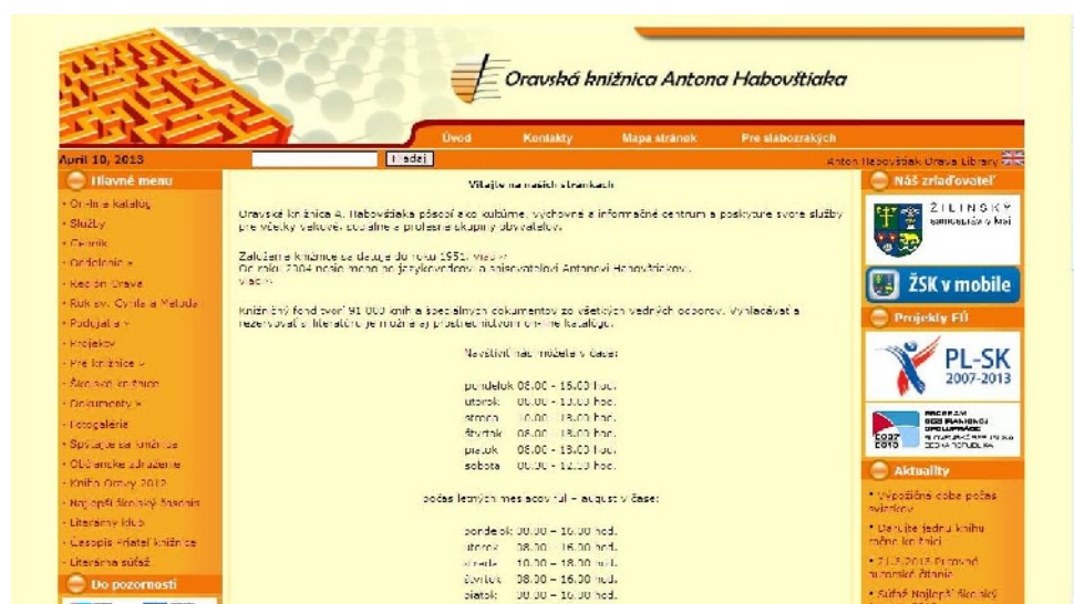
Webová stránka knižnice.

Oravská knižnica A. Habovštiaka poskytuje svojim používateľom prostredníctvom svojej webovej stránky ( www.oravskakniznica.sk ) aj online služby: prístup do on-line katalógu knižničného fondu a bibliografickej databázy regionalík, prístup do súborného katalógu regionálnych knižníc Žilinského kraja, databázy medailónov nežijúcich osobností Oravy, prezeranie a kontrola svojho konta, predĺženie výpožičnej doby dokumentov, rezervácia dokumentu, možnosť zaslania elektronickej žiadanky pre medziknižničnú výpožičnú službu a vypracovanie rešerše, zasielanie upomienok a oznámení o rezervovaných knihách prostredníctvom mailovej komunikácie, elektronické poskytovanie informácií a on-line referenčné služby (napr. elektronické zasielanie naskenovaných článkov,