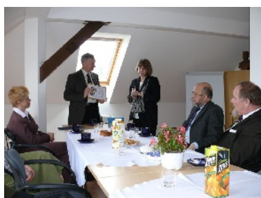
Týždeň slovenských knižníc, udelenie ceny SAKAČIK.