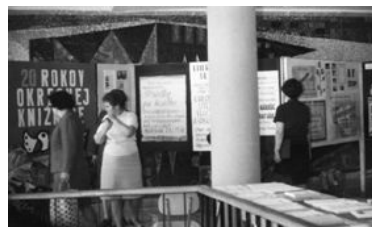
Pohľad na výstavu pri príležitosti 20. výročia založenia knižnice.