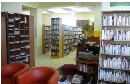
Oddelenie beletrie, centrálny zápis čitateľov.

Pre zabezpečenie slobodného prístupu k informáciám realizuje knižnica nákup univerzálneho knižničného fondu, ktorý obsahuje viac ako 100 000 dokumentov (43 % tvorí náučná literatúra pre dospelých, 37 % krásna literatúra pre dospelých, 6 % náučná pre deti a 14 % krásna pre deti). Základ tvoria knižné publikácie, časopisy a noviny miestneho, regionálneho, krajského a celoštátneho charakteru a špeciálne dokumenty (hudobniny, mapy, gramoplatne, magnetofónové a video kazety, CD a DVD nosiče, CD-ROMy a iné audiovizuálne dokumenty). V prevažnej miere sú vo fonde zastúpené dokumenty v slovenskom jazyku, v menšom počte v českom, anglickom, nemeckom, poľskom, ruskom, francúzskom a iných jazykoch. K literatúre majú používatelia voľný prístup, okrem špeciálnych dokumentov, starších ročníkov periodík a literatúre, zaradenej do príručných knižníc. Nový knižničný fond sa získava formou nákupu z finančných zdrojov od zriaďovateľa a vlastných príjmov, darov (od vydavateľstiev, nadácií, sponzorov a jednotlivcov), výmenou s inými subjektmi, najmä kultúrnymi inštitúciami, povinným výtlakom – regionálna periodická tlač, nákupom z grantových prostriedkov, najmä Ministerstva kultúry SR.