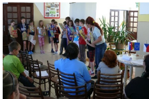
Poznávací pobyt pre slovenské a české deti, realizovaný v rámci cezhraničnej spolupráce s Regionální knihovnou Karviná.

Medzinárodný seminár pod názvom Knižnice a vydavateľstvá – ich postavenie a možnosti v súčasnej spoločnosti poskytol priestor na výmenu odborných skúseností v oblasti knižnično-informačnej práce, prezentáciu regionálnych i slovenských vydavateľstiev, ako aj zhodnotenie pokračujúcej spolupráce obidvoch partnerov. Záverečné podujatie projektu – letné tvorivé workshopy v Zázrivej