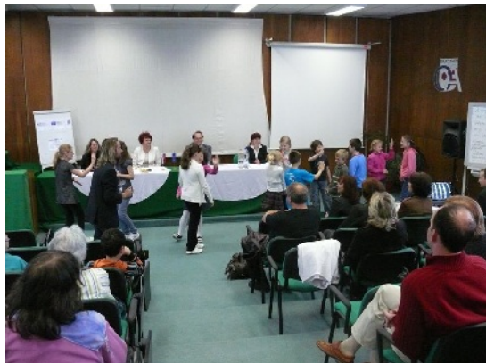
Medzinárodná konferencia na tému výmena skúseností v problematike podpory záujmu detí o čítanie, realizovaná v rámci cezhraničnej spolupráce s Regionální knihovnou Karviná.

nadväzovali výtvarné dielne v ilustrovaní prečítaných povestí, výtvarné práce detí boli následne zaslané do medzinárodnej výtvarnej súťaže. Slovenské a české deti sa zúčastnili na štvordennom poznávacom pobyte v Dolnom Kubíne, pracovníci Oravskej knižnice a ďalších verejných knižníc Žilinského kraja absolvovali poznávaciu exkurziu do Karvinej. V rámci